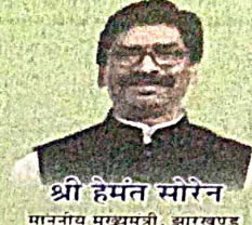
श्री हेमंत सोरेन माननीय मुख्यमंत्री, झारखण्ड